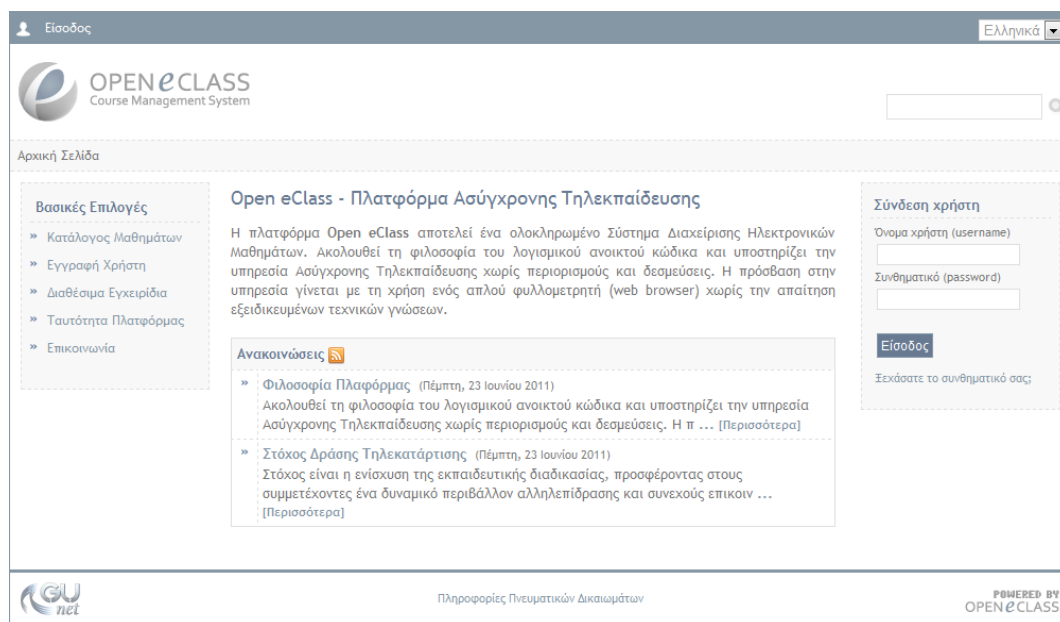
Εικ.5 Αρχική σελίδα πλατφόρμας Open eClass

Η αρχική σελίδα της πλατφόρμας περιλαμβάνει: τον κατάλογο των μαθημάτων που φιλοξενούνται, τις διεπαφές δημιουργίας λογαριασμού χρήστη (εκπαιδευόμενου και εκπαιδευτή), όλα τα χρήσιμα εγχειρίδια, την ταυτότητα της πλατφόρμας όπου παρουσιάζονται χρήσιμα στατιστικά για τη χρήση της πλατφόρμας καθώς και τα στοιχεία επικοινωνίας με τους υπεύθυνους διαχειριστές.