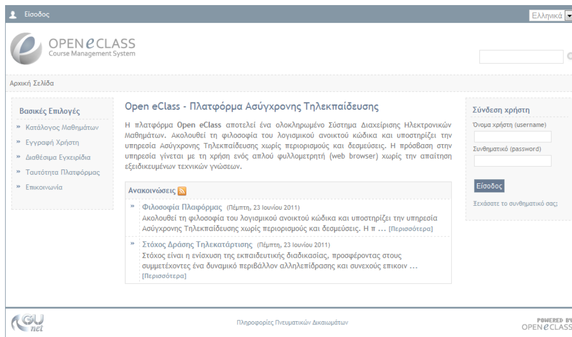
Εικ.1 Η πλατφόρμα Open eClass

Η πλατφόρμα Open eClass είναι ένα ολοκληρωμένο Σύστημα Διαχείρισης Ηλεκτρονικών Μαθημάτων και αποτελεί την πρόταση του Ακαδημαϊκού Διαδικτύου (GUnet) για την υποστήριξη Υπηρεσιών Ασύγχρονης Τηλεκπαίδευσης. Έχει σχεδιαστεί με προσανατολισμό την ενίσχυση της εκπαιδευτικής διαδικασίας, βασίζεται στη φιλοσοφία του λογισμικού ανοικτού κώδικα, υποστηρίζεται ενεργά από το GUnet και διανέμεται ελεύθερα.